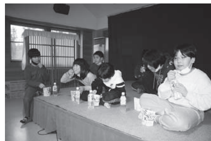
非常食を食べる子どもたち