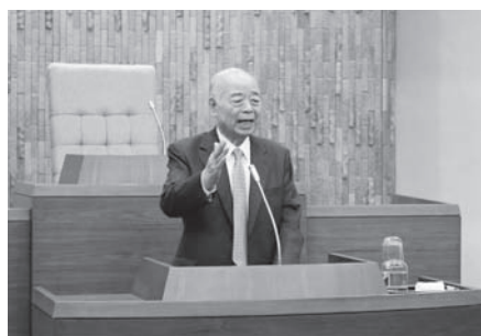
木古内について 熱弁された高向講師

毎年、このような研修会を一般町民等にも解放して実施しますので、参加をお待ちしております。