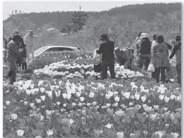
チューリップの花が満開