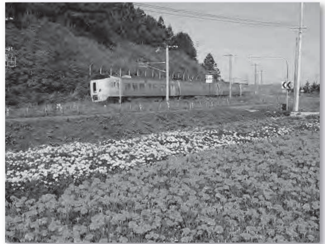
列車とマリーゴールド