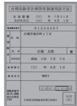
新しい限度証は黄緑色です

現在ご使用の水色の限度証の有効期限が7月31日をもって満了となるため、8月以降は使用できなくなります。有効期間は保険証と同じく1年間です。引き続き交付対象に該当する方は7月中に限度証を交付しますので、8月1日からは黄緑色の限度証をご使用ください。新たに必要となる方は、下記の交付要件に該当することをご確認の上、町民課住民グループへ申請してください。